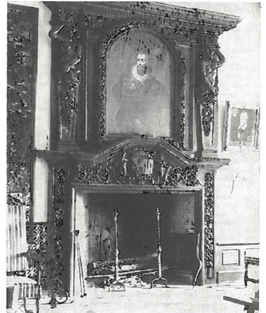
Cheminée Renaissance du château