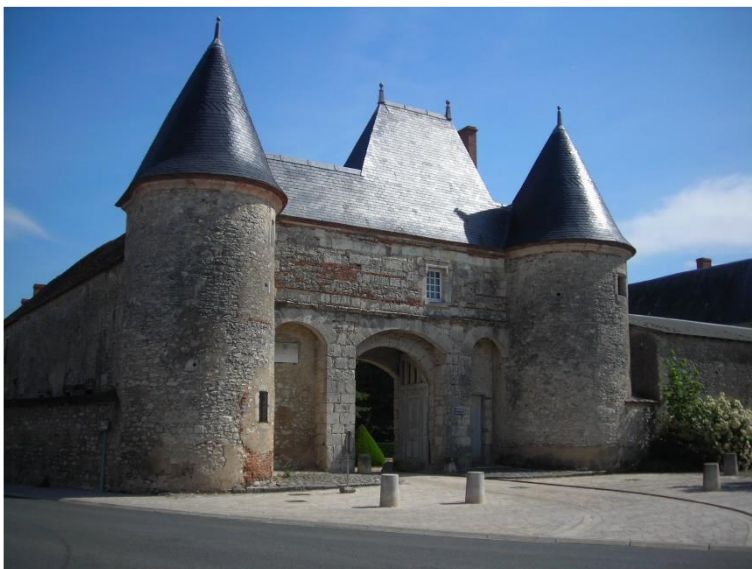
L'entrée du Château