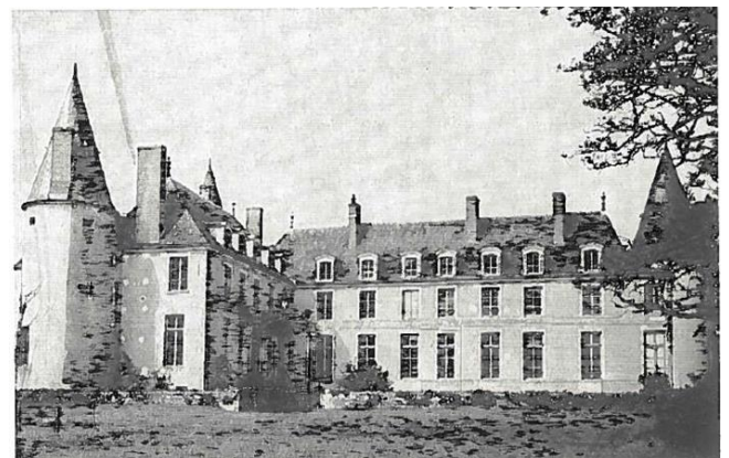
Le Château façade Est